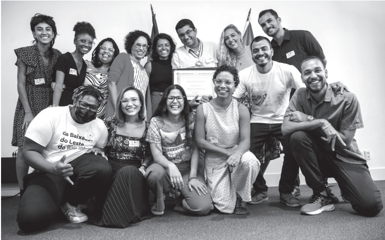
Equipe da Casa Fluminense recebendo a Medalha Tiradentes, na ALERJ.