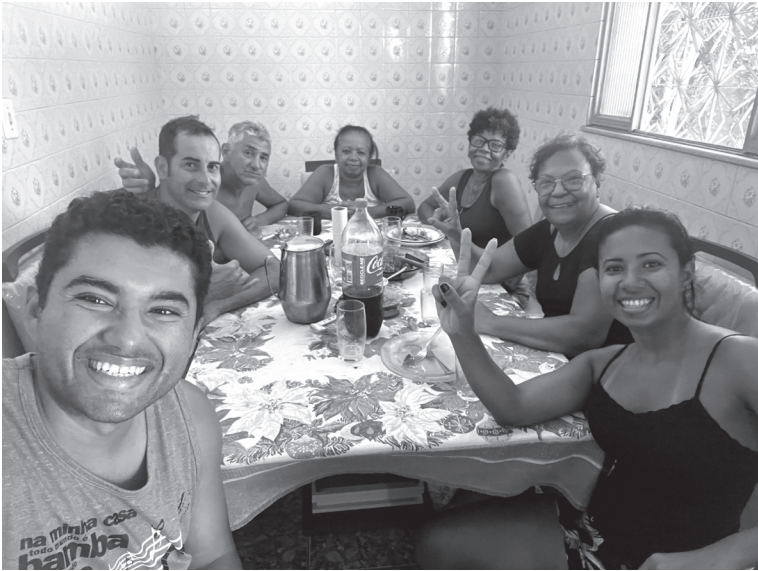
Almoço com a família em Santa Lúcia, Imbariê.