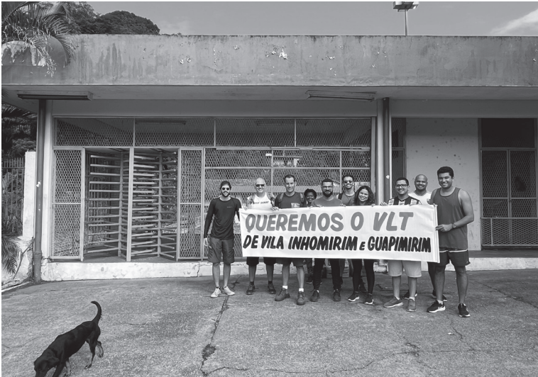
Ato pela revitalização do ramal Vila Inhomirim, em Raiz da Serra, Magé, 2023.