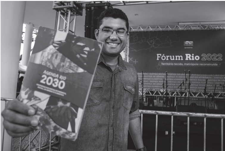
Agenda Rio 2030.