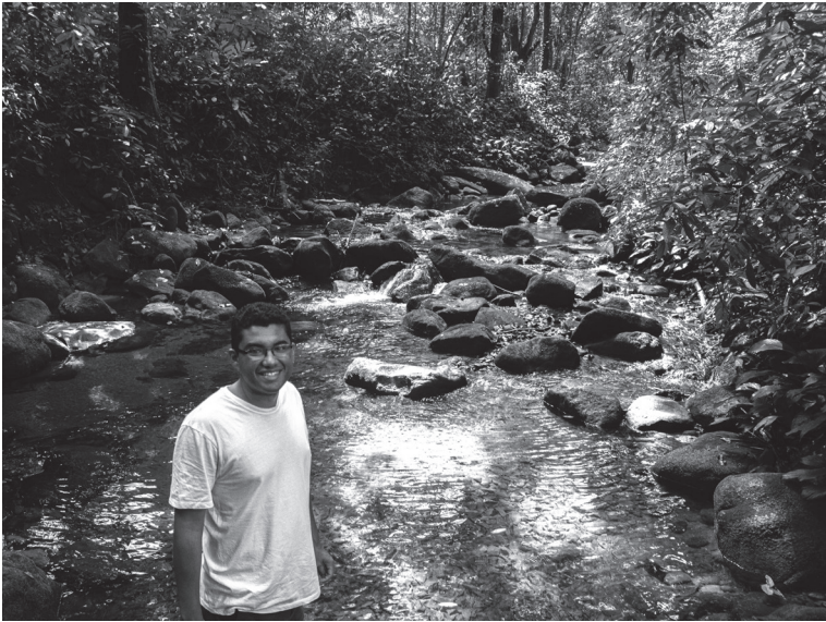
Cachoeira da Taquara, Duque de Caxias.