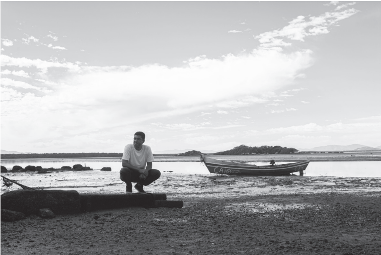
Fundo da Baía de Guanabara, no Pier Piedade, Magé.