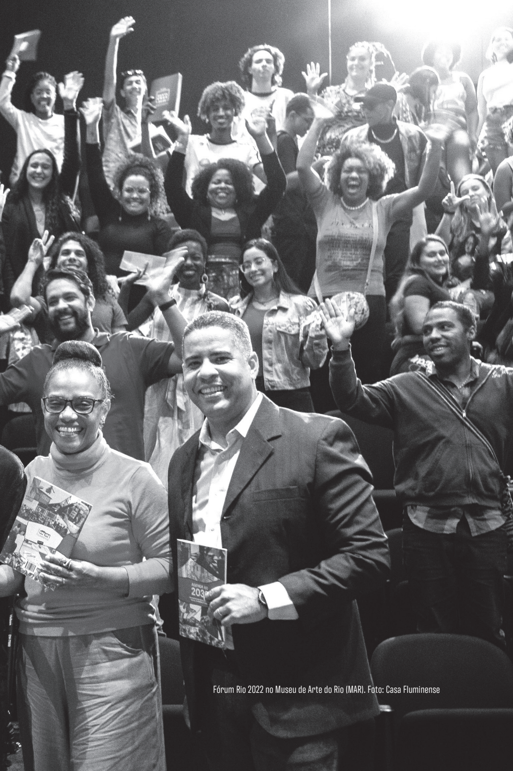
Fórum Rio 2022 no Museu de Arte do Rio (MAR).