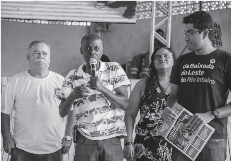
Fórum Rio em Japeri, 2019.