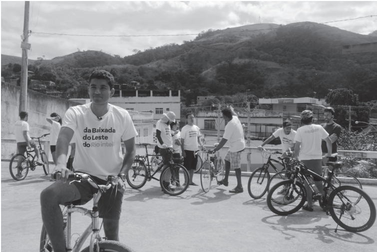
Bicicletada Metropolitana, Japeri, 2016.