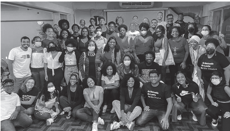
Curso de Políticas Públicas da Casa Fluminense.