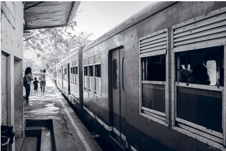
Trem Maria Fumça, na estação Manoel Belo, Santa Lúcia.